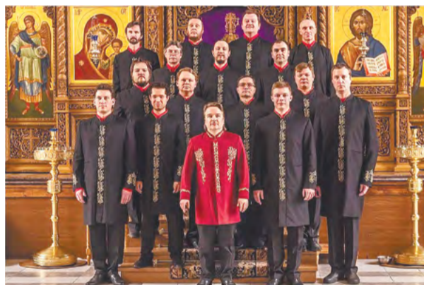
ГРАФИК ВЫСТУПЛЕНИЯ ХОРА ВАЛААМСКОГО МОНАСТЫРЯ:

♦ ПРОДАЮ ГАРАЖ в ГСПК 12. Тел. 8(916)488-76-10.